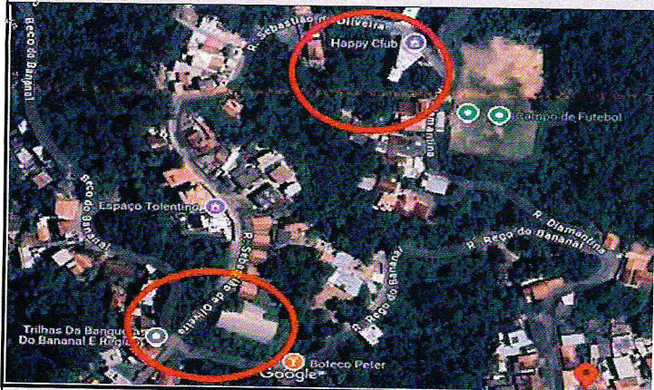
FOTO 01 - PLANTA DE SITUAÇÃO