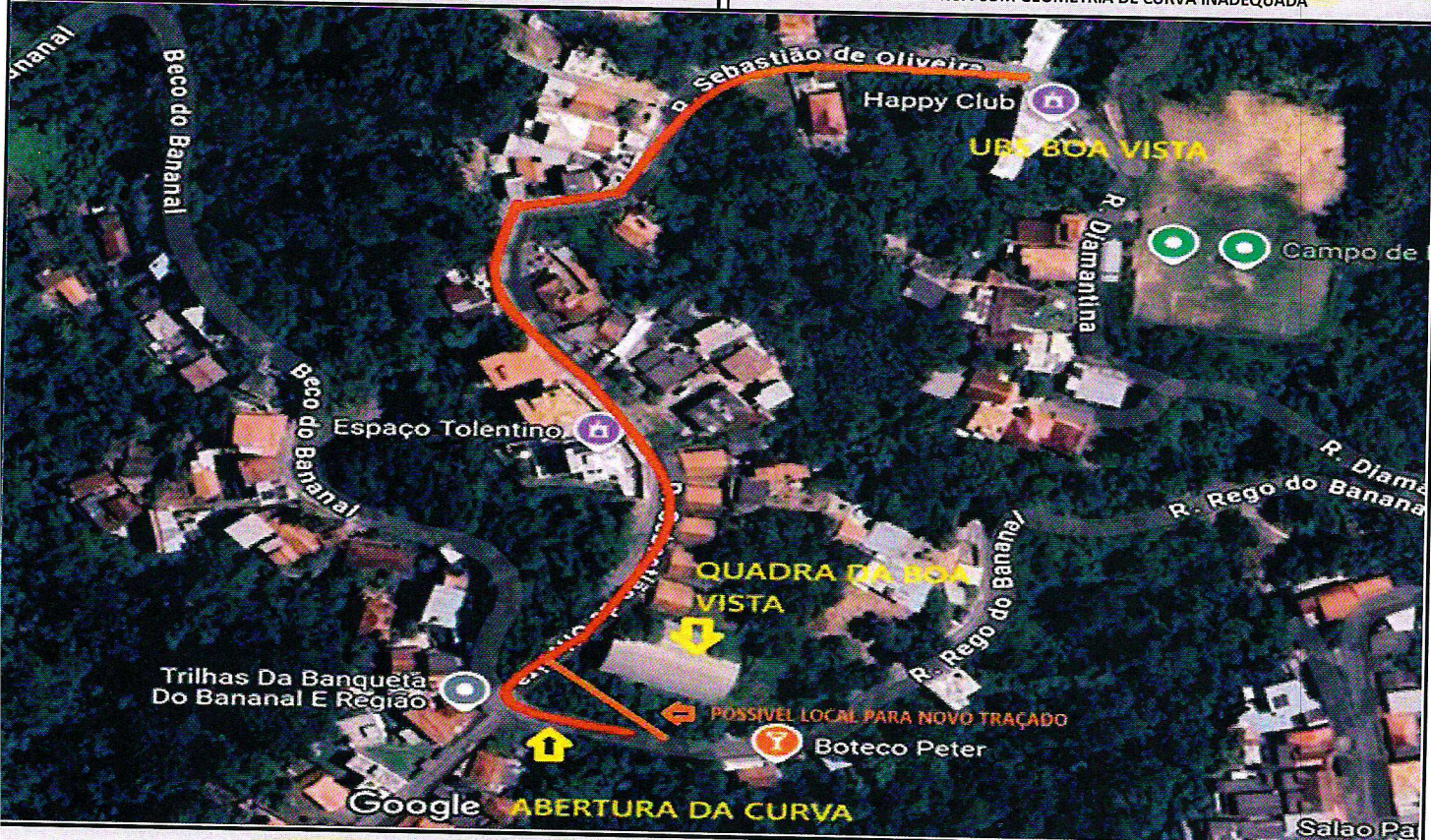
FOTO 05 - ADEQUAÇÃO DO RAO DE CURVATURA PARA MELHORIA DA ACESSIBILIDADE DE VEÍCULOS DE GRANDE PORTE